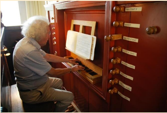
Zeemansorgel Van Goghkerk