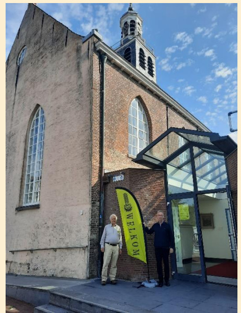
Vanaf nu hebben we een fraaie banner paraat om goed op te vallen!

Heeft u dit gemist? Niet erg want er komt er nog één!!