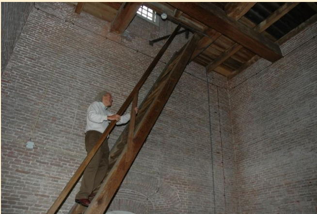
Tot op hoge leeftijd elke woensdagochtend naar de toren!