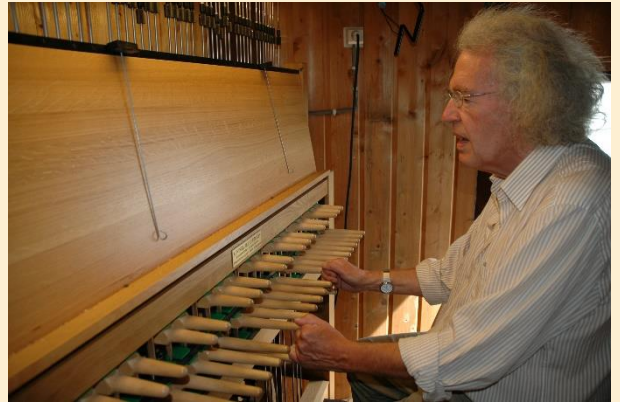
Als beiaardier in de Van Goghkerk